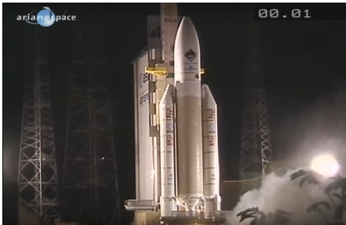
Figure 1 – Le lancement de la sonde Rosetta (vol Ariane VA158) le 2 mars 2004. Le compte à rebours est affiché en haut à droite de l'image et est scandé dans la bande-son de la vidéo. https://www.youtube.com/watch?v=RqPCCzI3BUQ