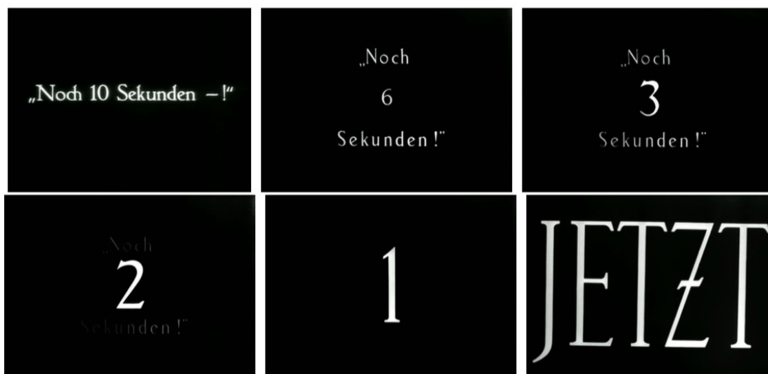
Figure 3 – Les cartons du compte à rebours dans le film de Fritz Lang La Femme sur la Lune .