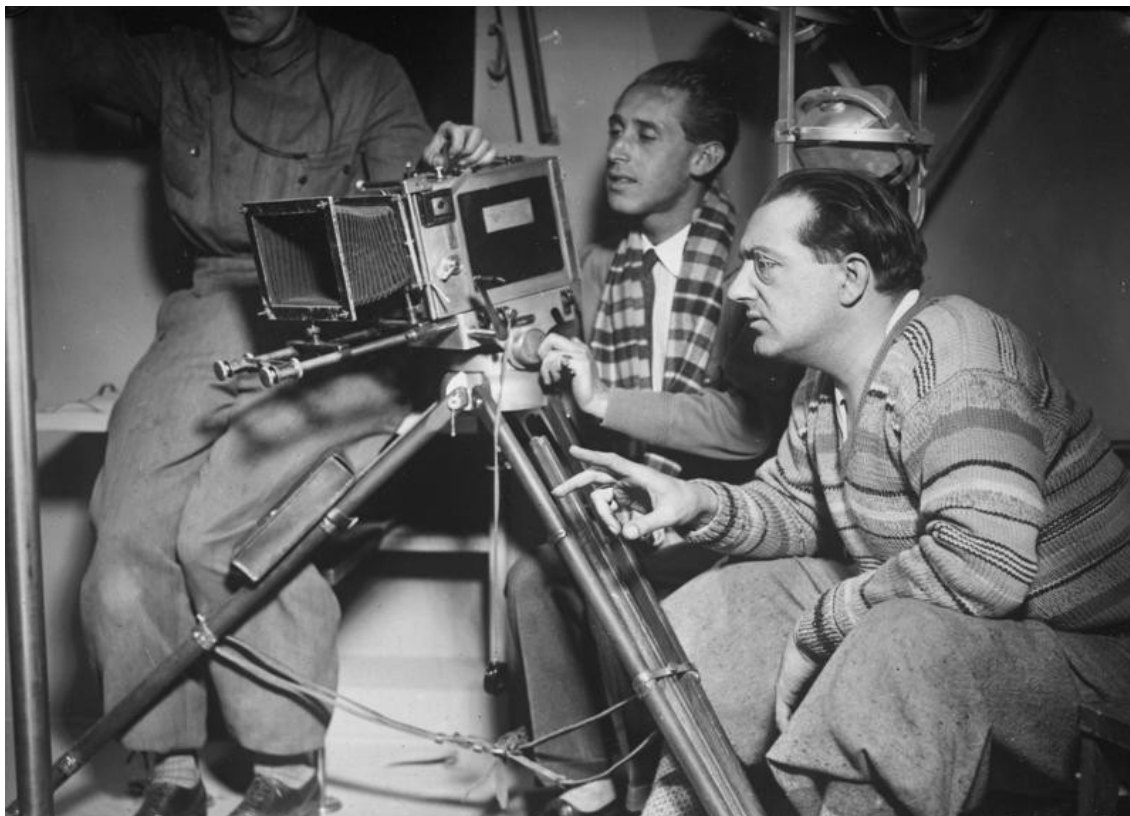
Figure 2 – Fritz Lang sur le tournage de La Femme sur la Lune .