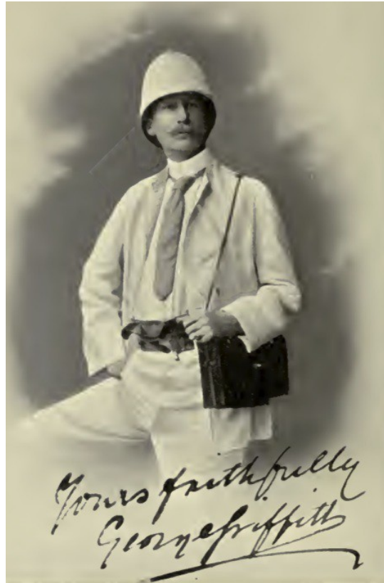
Figure 5 – George Griffith (1857–1906). Portrait figurant dans In an Unknown Prison Land , Hutchinson and Co, Londres, 1901.

bagne alors qu'une épidémie de peste bubonique y sévissait depuis décembre 1899. Il a refusé de renoncer à sa visite malgré les injonctions des autorités françaises. Et il fut le premier auteur de science fiction à tirer (au canon !) sur une comète.