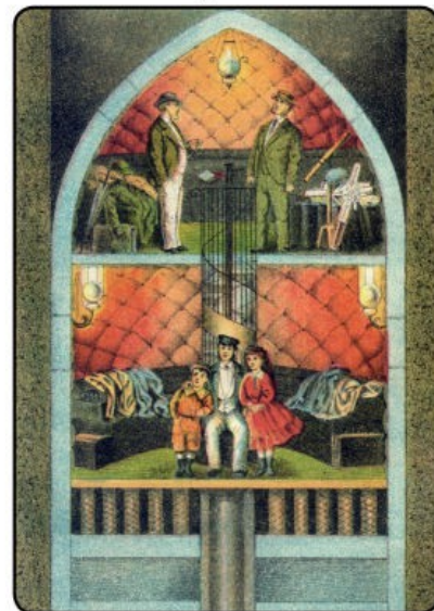
Thadewalds Spaziergänge durch die Vernistik Band 2

DIE REISE NACH DEM MOND Nach Jules Verne